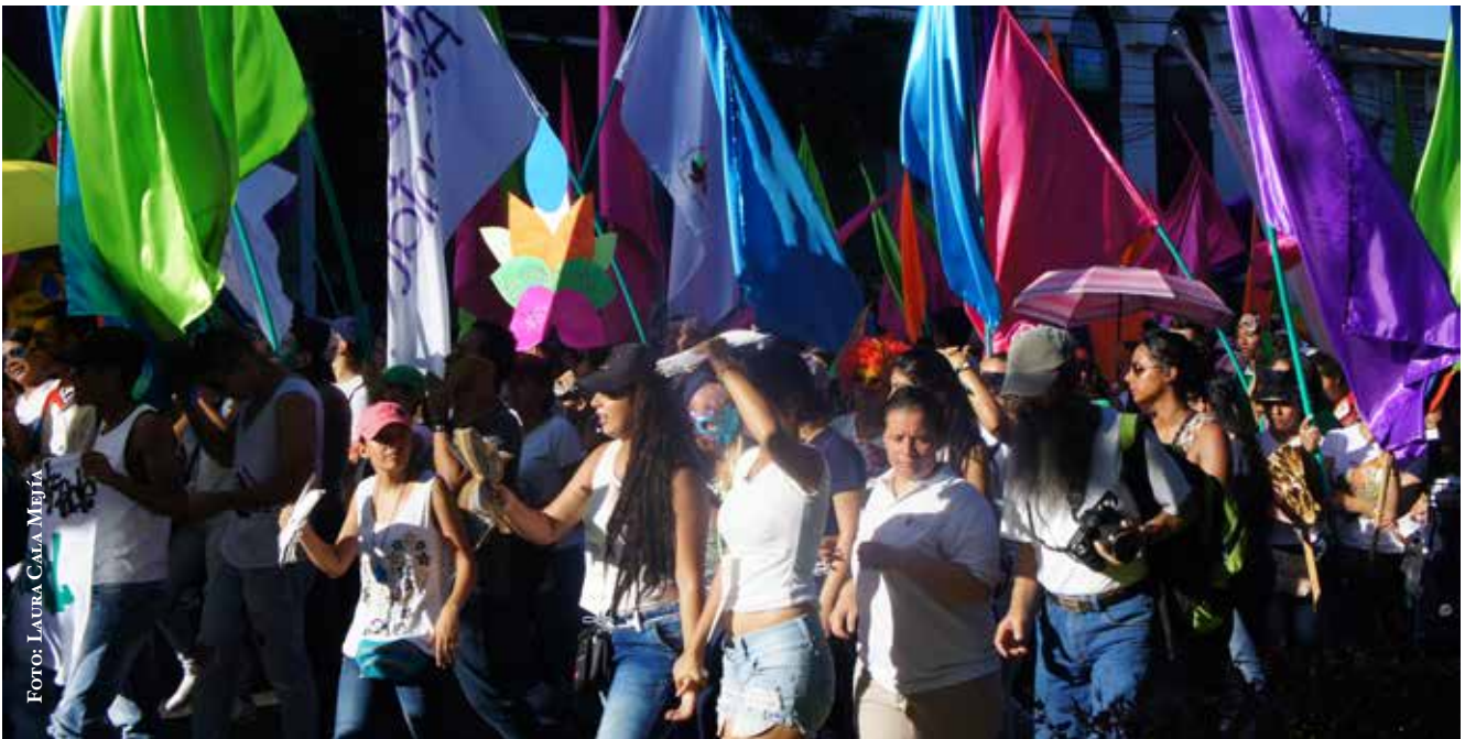
Marcha Carnaval en Ibagué, Tolima. 2017.

Así, si bien se pueden ubicar más o menos los escenarios de participación ambiental existentes, lo cierto es que carecemos de estudios sobre su calidad, en términos de la incorporación efectiva de las preocupaciones de los interesados en las decisiones finales o la influencia efectiva que han tenido en su reforma o acomodo, en el sentido expresado por la Comisión Interamericana de Derechos Humanos -CIDH-: “el deber de los Estados es el de ajus-